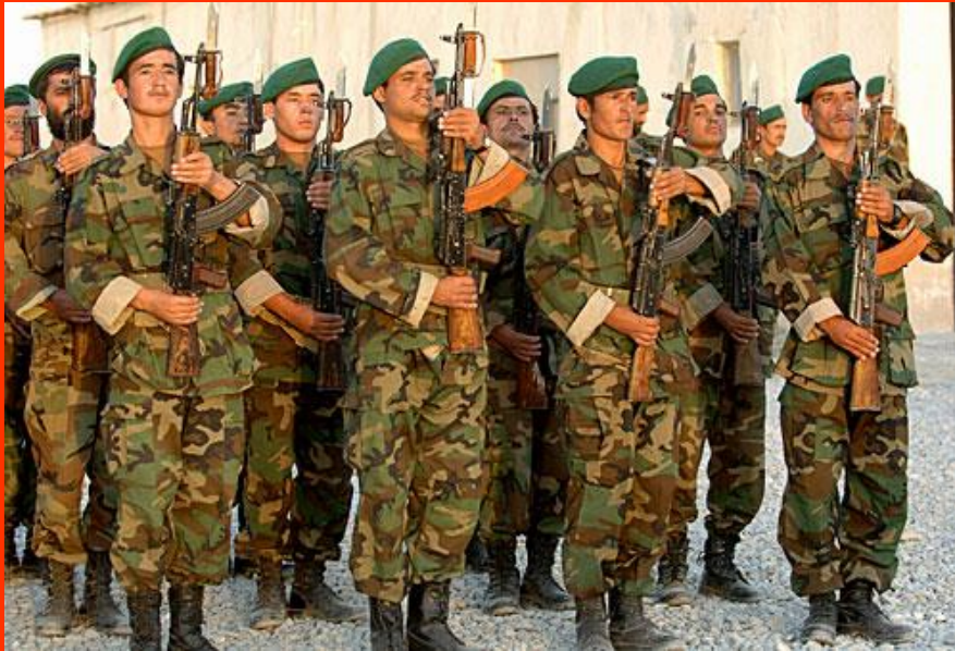
Afghan National Army