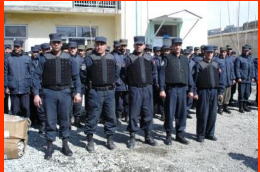
Afghan Police Force